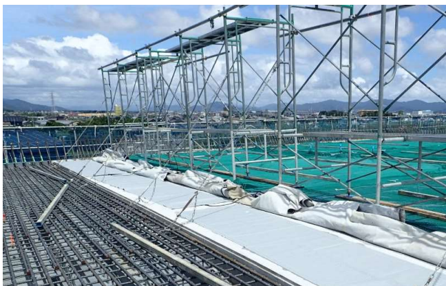
● 橋梁上部工事のコンクリート打設