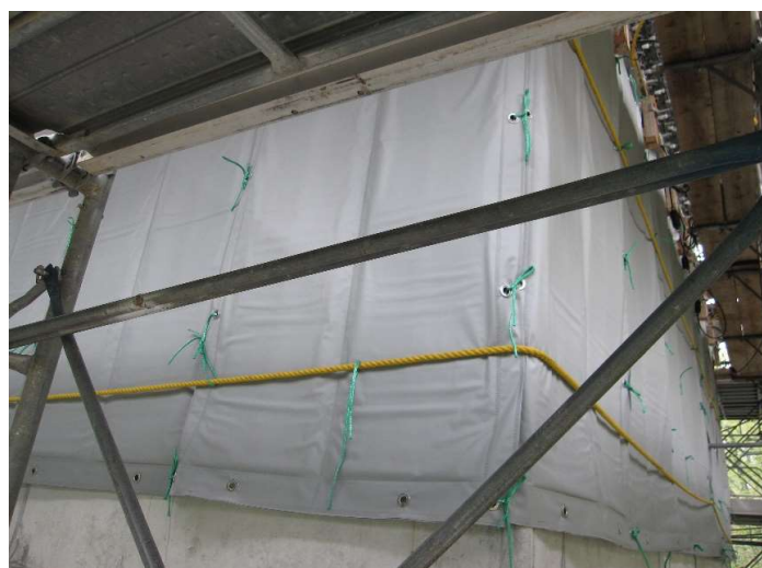
● 高規格幹線道路の橋梁工事のコンクリート打設