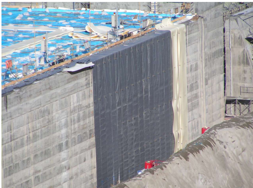
● ダム堤体 寒中コンクリート垂直面の施工事例