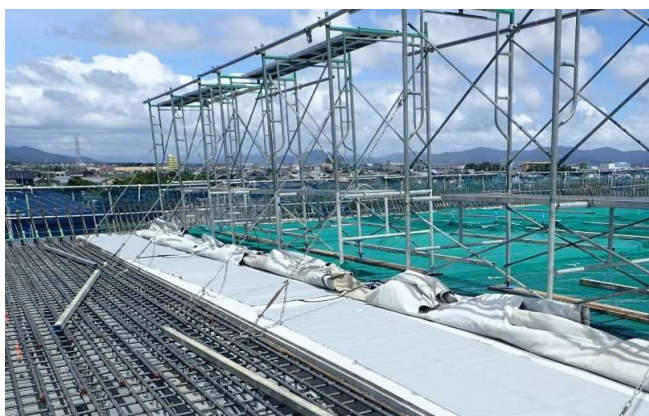
● 橋梁上部工事のコンクリート打設